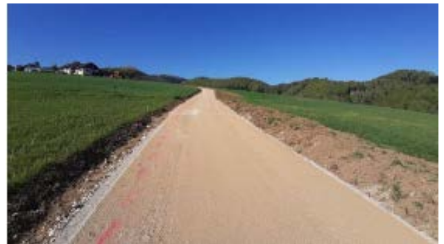
Chemin Les Champs de Courcelles – pose de la planie