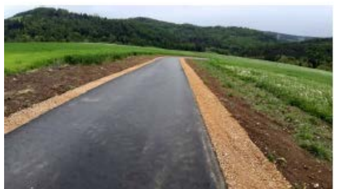
Chemin Les Champs de Courcelles – travaux terminés