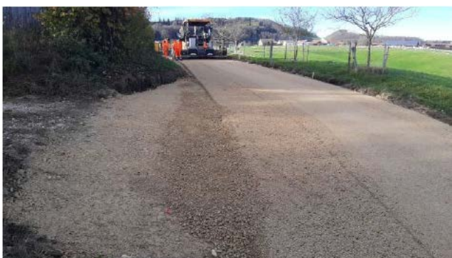
Chemin Fin de Vanné et Dos les Cras – réalisation de la planie

Les travaux de la 2 ème étape de réfection des dessertes agricoles se poursuivent. Quelques photos pour illustrer l'avancement des travaux :