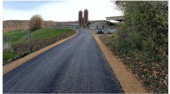
Chemin Fin de Vanné et Dos les Cras – enrobé posé et banquettes réalisées