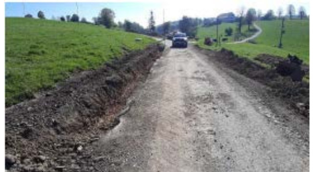
Chemin Les Houelets – décapage et creusage des bords