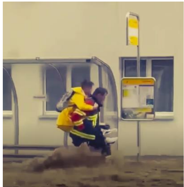
Inondation du 10.07.2021, Place de la liberté 69, Pompier sauvant un habitant.