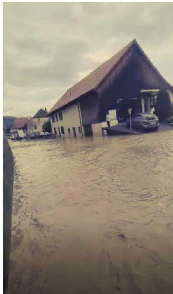
Inondation du 10.07.2021, route cantonale complètement submergée