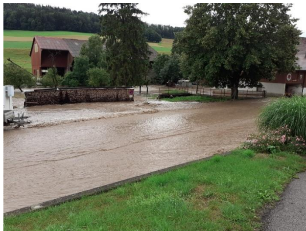
Rue de la Liberté