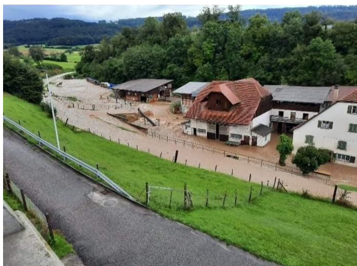
La Fenatte - Ferme "Le Moulin" – Route de Bourrignon