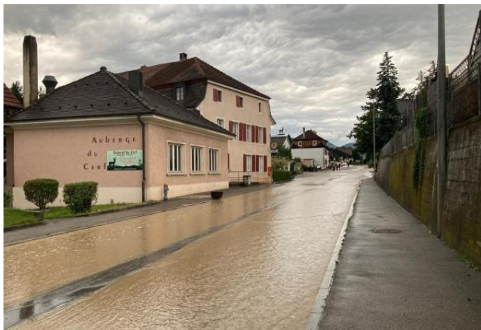
Auberge du Cerf – Rue de la Liberté