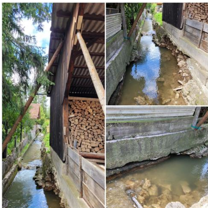
Dégâts murs de berge – La Prunelle