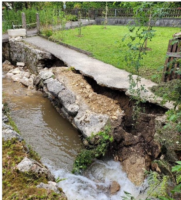
Dégâts murs de berge – La Fenette