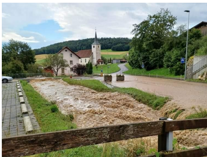
La Fenatte – Route de Bourrignon